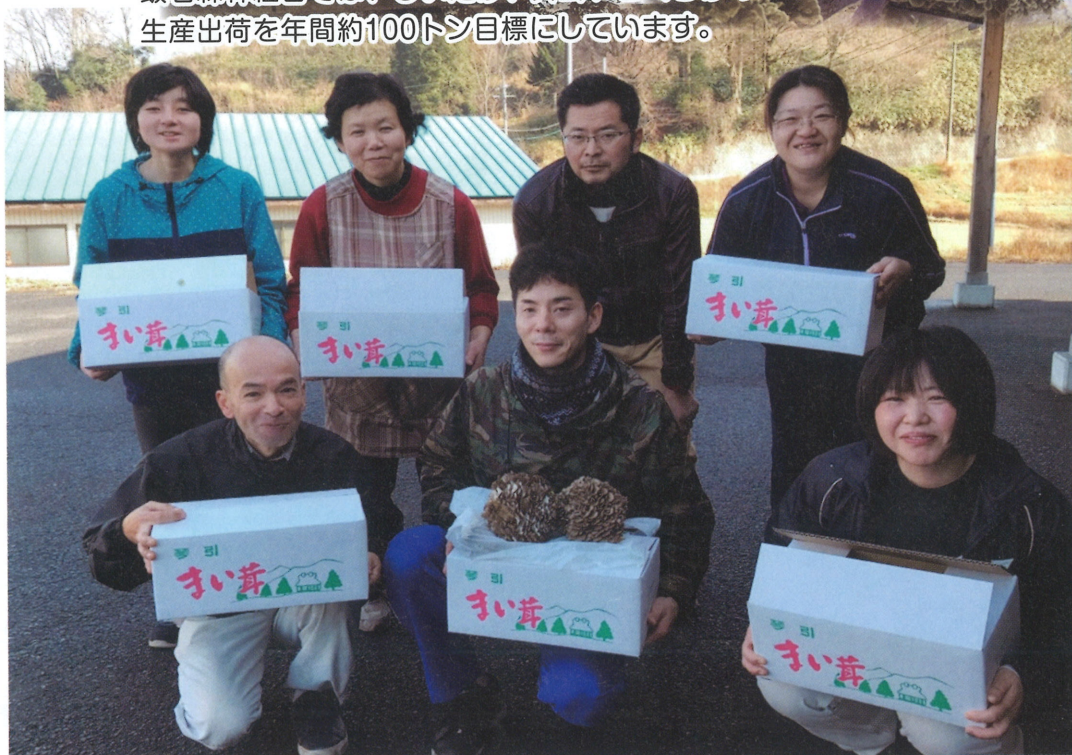
飯南町にある、佐見きのこセンター従業員の皆さん

新しい年がスタートしました。 飯石森林組合では、しいたけ、舞茸、きくらげの 生産出荷を年間約100トン目標にしています。